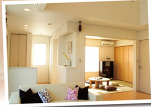
掲載写真はイメージです。